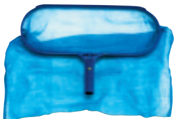
Epuisette de fond