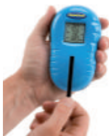
Lecteur de mesures (pH, chlore, TAC)