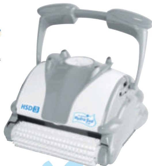
Robot pour le fond et les parois

Avant la remise en service de votre bassin, vérifiez que votre dispositif de sécurité soit opérationnel.