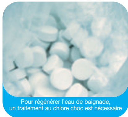
Pour régénérer l'eau de baignade, un traitement au chlore choc est nécessaire

Le pH de l'eau de votre piscine doit se situer entre 6,9 et 7,4