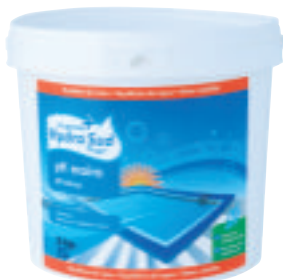
Correcteur de pH